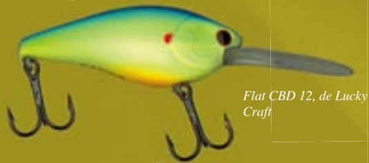
Flat CBD 12, de Lucky Craft

No es fácil creer en un señuelo terminado hasta que no se consigue algún resultado tangible; luego resulta más sencillo ir ganando confianza y experimentar diferentes variables en acción de pesca. Para ayudarte a resolver el problema de seleccionar los señuelos y las técnicas básicas que producen los lucios más grandes te ofrecemos la siguiente relación: