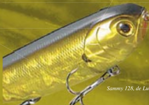
Sammy 128, de Lucky Craft