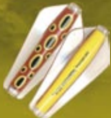
Tasmanian Devil de 7 gr., de Wingston's Lures