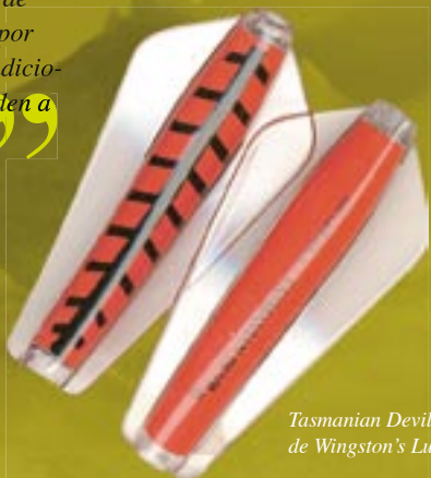
Tasmanian Devil de 26 gr., de Wingston's Lures